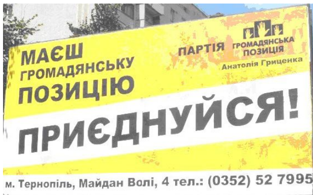
Рис. 1. Білборд політичної партії «Громадянська позиція», 2014