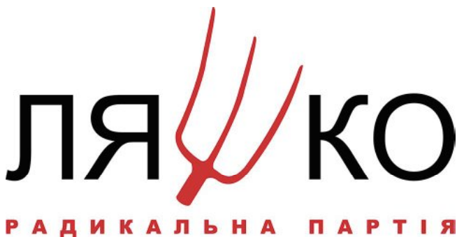
Рис. 5. Вид 1. Символіка партії Олега Ляшка. 2013