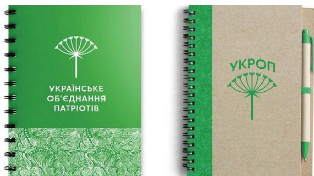
Рис. 4. Застосування шрифту в представницькій поліграфії політичної партії «Укроп», 2015