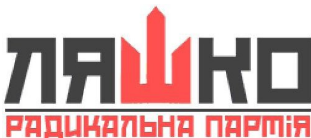
Рис. 6. Вид 2. Партійна символіка Радикальної партії Олега Ляшка. 2014