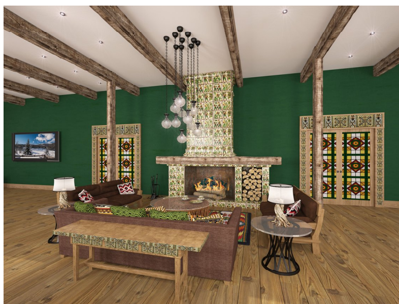
Рис. 3. Аріна Корякіна. Тривимірна модель зони каміну