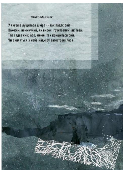
Рис. 2. Ілюстрація Надії Злобинець до першої строфи вірша «Сніг» поетеси Ірини Шувалової