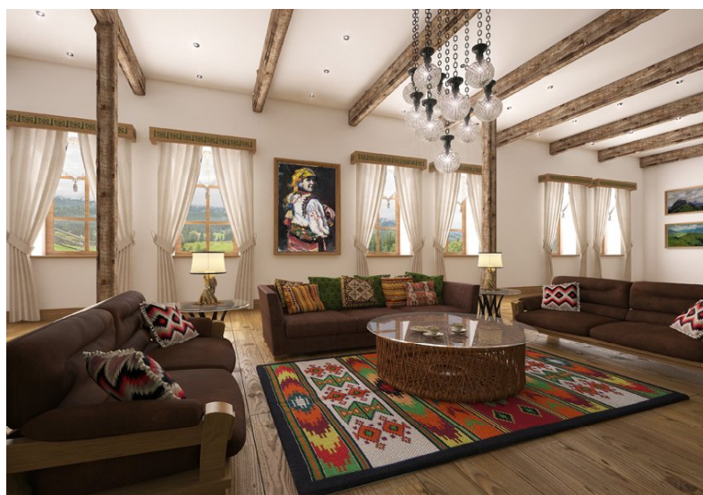
Рис. 4. Аріна Корякіна. Тривимірна модель зони каміну (центральна частина)