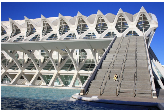
Рис. 2. Комплекс. Музей мистецтв і науки, м. Валенсія, Іспанія. Архітектор: Сантьяго Калатрава.

інструменту комунікації вона непомітно перетворилася на один із комерційних інструментів музейного маркетингу, а також обговорюють питання: як довго триватиме інтерес публіки до архітектури видовищних музеїв-атракціонів і як майбутні покоління оцінять будівлі, подібні до музею Гуггенхайма в Більбао.