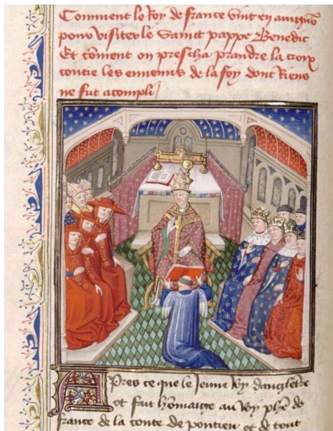
Іл. 4. Папа Бенедикт XII. Жан Фруассар «Хроніки», XV ст., Париж. Français 2675, fol. 37v. Національна бібліотека Франції. [URL : http://visualiseur.bnf.fr/Visualiseur?Destination=Mandragore&O=08100406&E=9&I=42502&M=imageseule ]