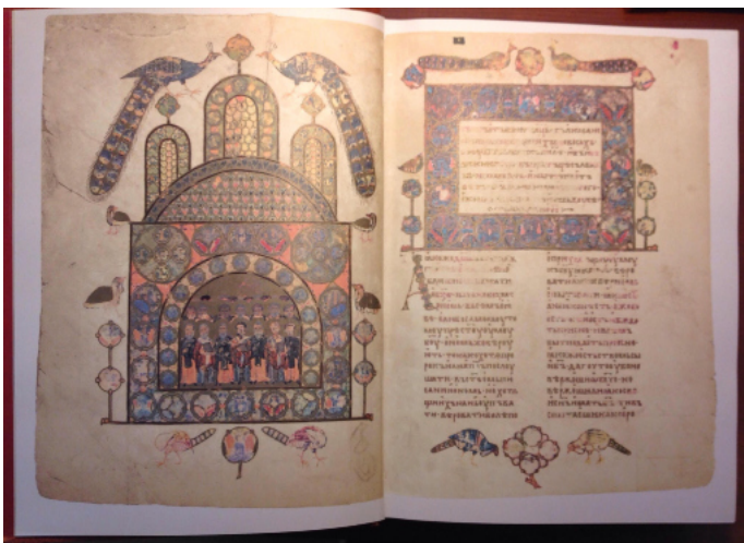
Іл. 7. Мініатюра. Ізборник Святослава 1073. Факсимільне видання (Москва, 1983).