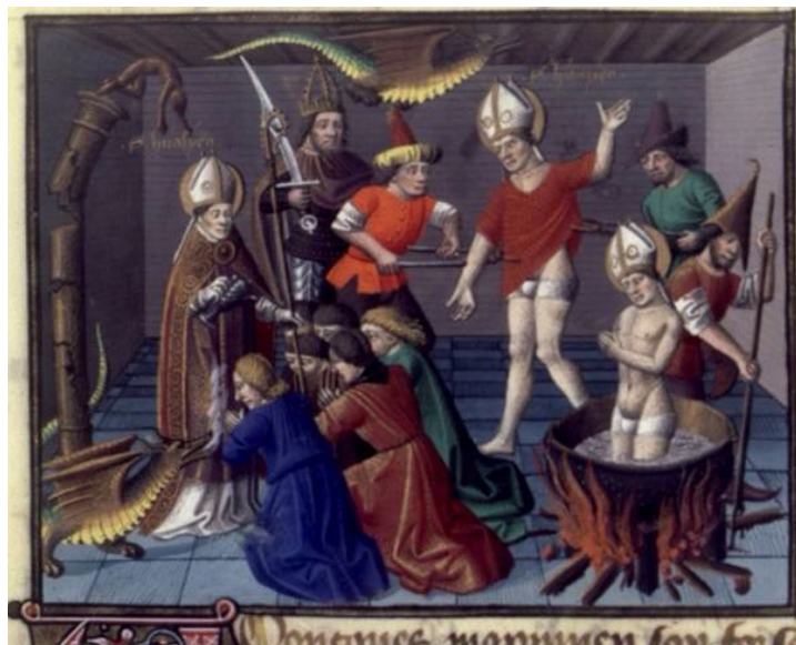
Іл. 2. Мученицька смерть святого Еразма. Вінсент з Бове «Дзеркало історичне», 1463, Париж. Français 51, fol. 53. Національна бібліотека Франції. [URL : http://visualiseur.bnf.fr/CadresFenetre?O=COMP-2&M=tdm ]