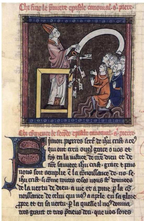
Іл. 3. Апостол Петро проповідує. Історична Біблія (Гіяр де Мулен), XIV ст., Сент-Омер. Français 152, fol. 500v. Національна бібліотека Франції. [URL : http://visualiseur.bnf.fr/Visualiseur?Destination=Mandragore&O=10525355&E=1012&I=24077&M=imageseule ]