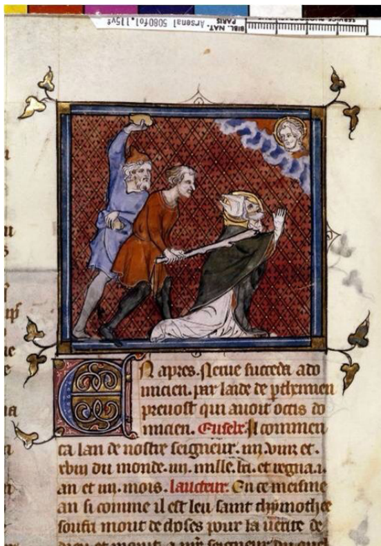
Іл. 1. Мученицька смерть святого Тимотея. Вінсент з Бове «Дзеркало історичне», 1335, Париж. Arsenal 5080, fol. 115v. Національна бібліотека Франції. [URL : http://visualiseur.bnf.fr/Visualiseur?Destination=Mandragore&O=07902849&E=1&I=170184&M=imageseule ]