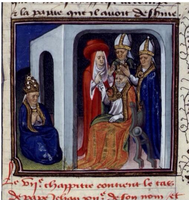
Іл. 5. Коронування Лева (Леона). Дж. Бокаччо «Про нещастя знаменитих людей», 1435–1140, Ліон. Français 229, fol. 367. Національна бібліотека Франції. [URL : http://visualiseur.bnf.fr/Visualiseur?Destination=Mandragore&O=10525132&E=739&I=26739&M=imageseule ]