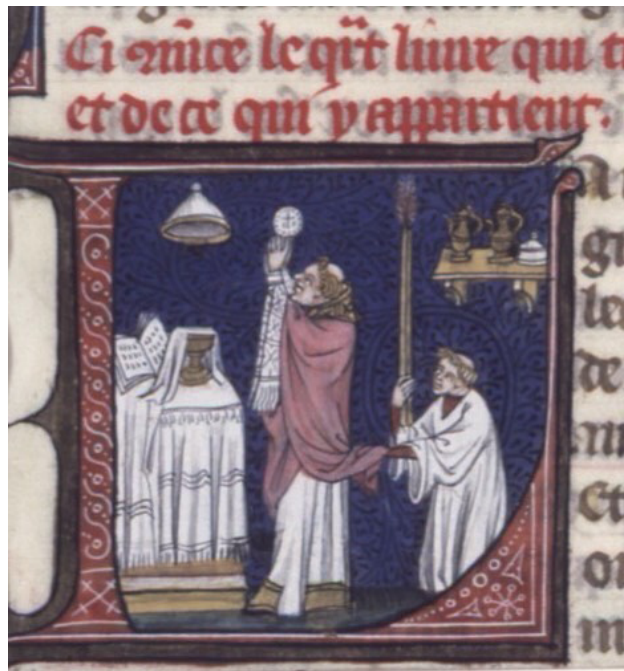
Іл. 6. Літургія. Гійом Дюран «Rationale divinorum officiorum», XIV ст., Париж. Français 176, fol. 56. Національна бібліотека Франції. [URL : http://visualiseur.bnf.fr/Visualiseur?Destination=Mandragore&O=8100230&E=6&I=25172&M=imageseule ]