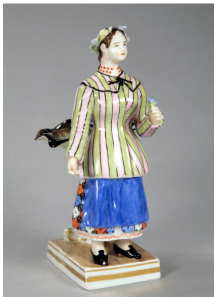
Іл. 22. Українка. Скульптура. Волокитине. Сер. XIX ст.