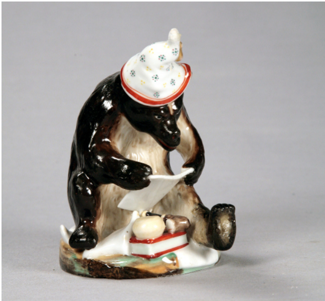
Іл. 19. Ведмідь. Скульптура. Волокитине. Сер. XIX ст.