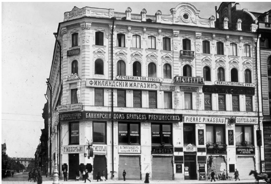
Іл. 2. Фасад будинку Гансена з боку Невського проспекту, 1912 р.

мав прізвисько «Апельсин». Такий збіг обставин видався цікавим, і дослідження було спрямовано на пошуки інформації про діда поляка. Відомості про нього зберігаються у вільному доступі мережі Інтернет. Проте повноцінне наукове дослідження про життя цієї людини було зроблено та опубліковано Германом Бертельсеном [29]. Нам пощастило спілкуватися з автором і зробити перший переклад його норвезького видання українською та російською мовами, що є унікальним матеріалом до біографії Оскара Германа Гансена.