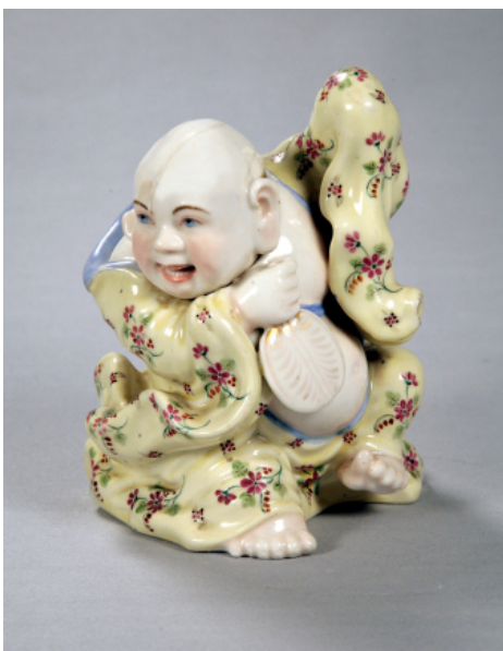
Іл. 21. Китайський божок. Скульптура. Волокитине. Сер. XIX ст.