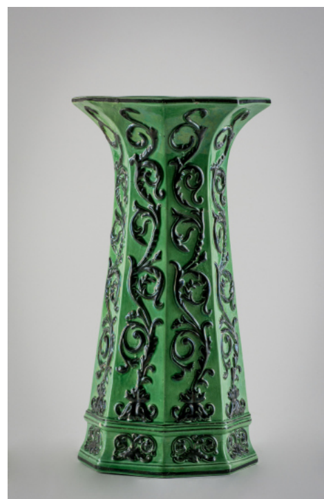
Іл. 16. Ваза. Києво-Межигірський фаянс. 1850 р.