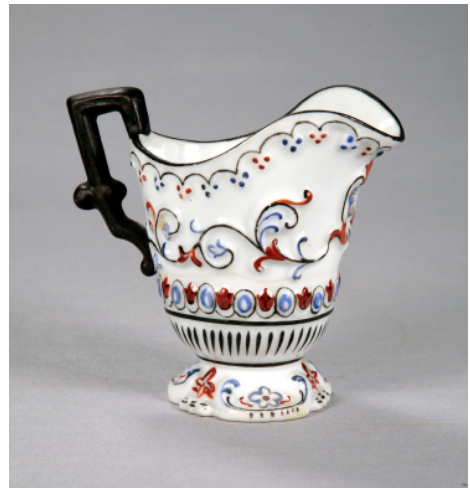
Іл. 18. Посудина для вершків. Волокитине. Сер. XIX ст.