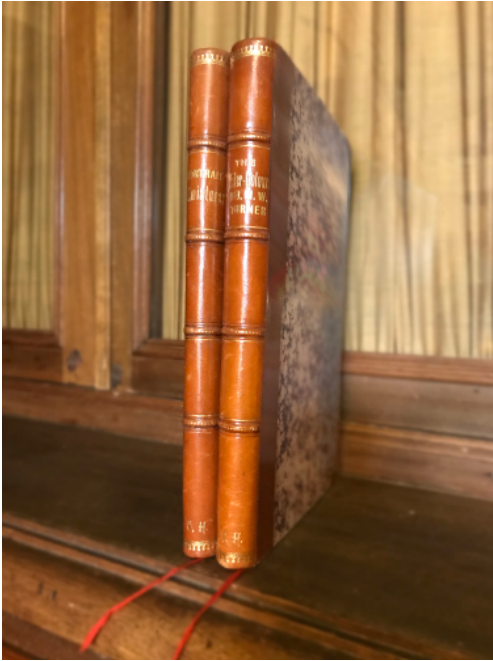
Лл. 6. Книги з бібліотеки О. Гансена. На корінці монограма власника — О.Н.