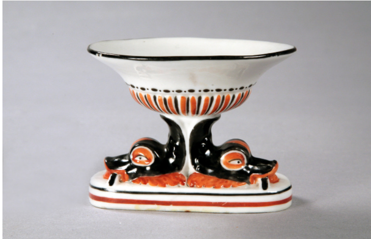
Іл. 17. Вазочка. Волокитине. Сер. XIX ст.