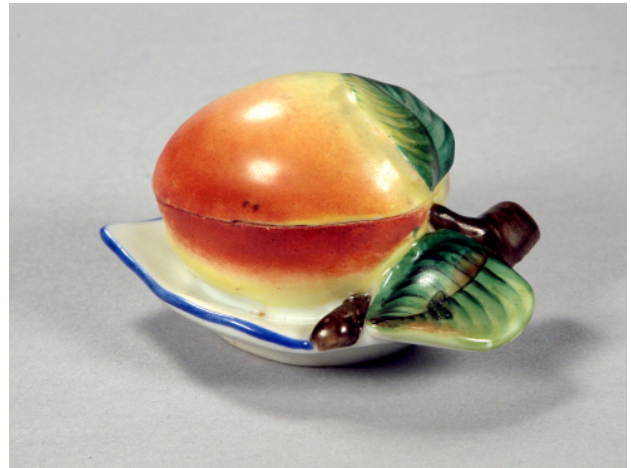
Іл. 20. Яблуко. Бонбоньєрка. Волокитине. Сер. XIX ст.