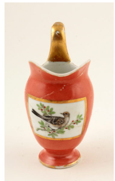
Іл. 23. Посудина для вершків. Баранівка. Поч. XIX ст.