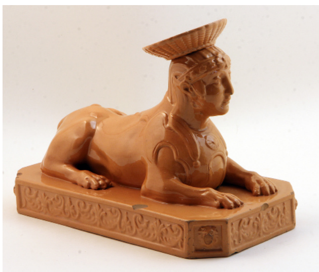
Іл. 15. Сфінкс. Скульптура. Києво-Межигірський фаянс. 1834 р.