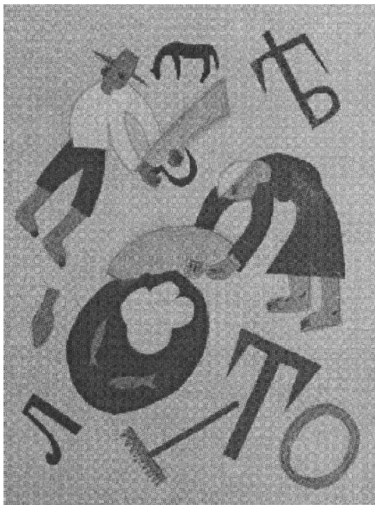
Рис. 9. В. Єрмилов. Ілюстрація до збірки віршів К. Неймаєр «Літо». 1920-ті рр. [12, с. 174]