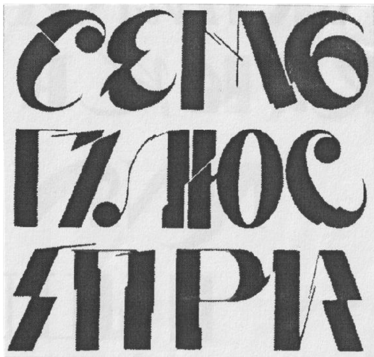
Рис. 5. Б. Косарев. Фронтиспіс альбома «Семь плюс три». Фрагмент. Харків. 1918 р. [12, с. 170]