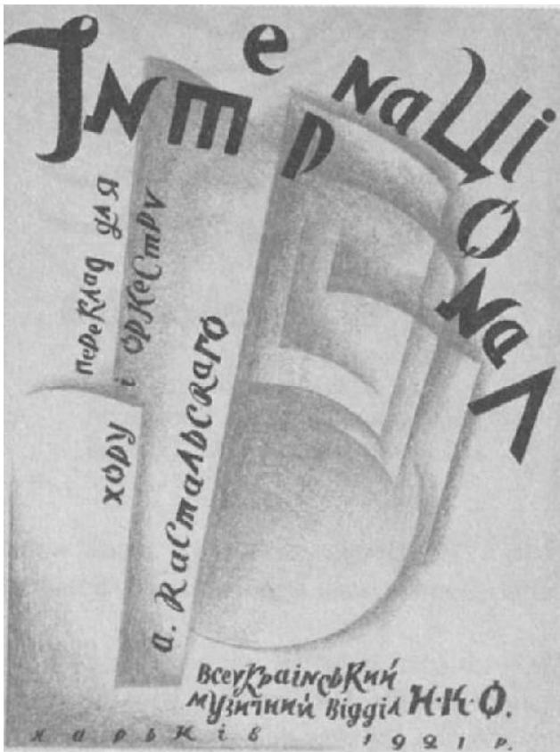
Рис. 7. В. Єрмилов. Обкладинка до видання «Інтернаціонал». Ескіз. 1921 р. [12, с. 174]