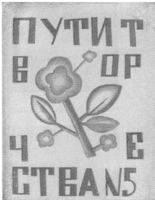
Рис. 3. Б. Косарев. Обкладинка часопису «Пути творчества». Ескіз. Харків. 1919 р. [12, с. 170]