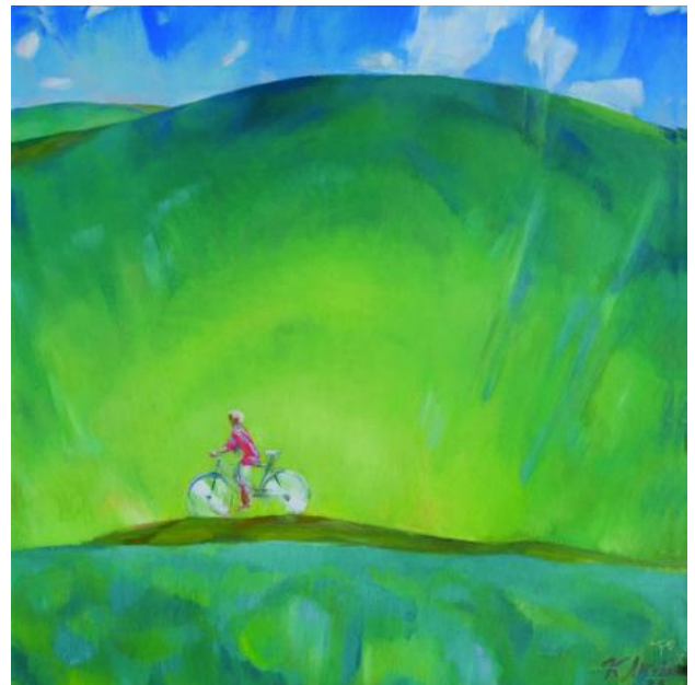
Іл. 5. К. Литвін. Поле. 1975. 57 × 57. Зберігається в родині художника.