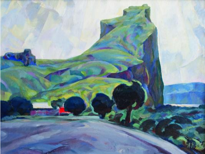
Іл. 1. К. Литвін. Девін. 1970. Полотно, олія. 100 × 75. Зберігається в родині художника.