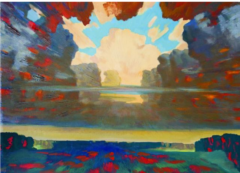
Іл. 10. К. Литвин. Берестецьке поле. 1996. 63 × 85. Зберігається в родині художника.