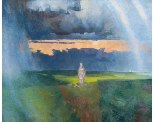
Іл. 7. К. Литвин. Степ. 1982. 50 × 60. Зберігається в родині художника.