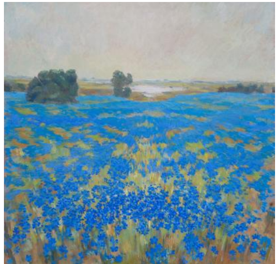
Іл. 9. К. Литвин. Льон цвіте. 1990. 50 × 50. Зберігається в родині художника.