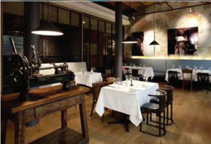
Таблиця 2. Характеристика застосування автентичного обладнання в інтер'єрах готелю Vienna House Andel's

— окремі елементи промислового обладнання відіграють роль перегородок, не відіграючи роль значних акцентів; — відреставроване обладнання у його автентичному вигляді експонується у приміщенні ресторану