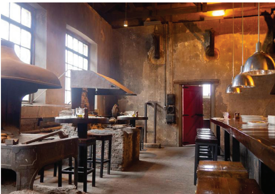
Таблиця 5. Характеристика застосування автентичного обладнання в інтер'єрах The Singular Patagonia Hotel

— збережене обладнання формує самостійну музейну експозицію; — певні об'єкти автентичного обладнання, що цілком інтегровані у середовище бару, також набувають експозиційного характеру