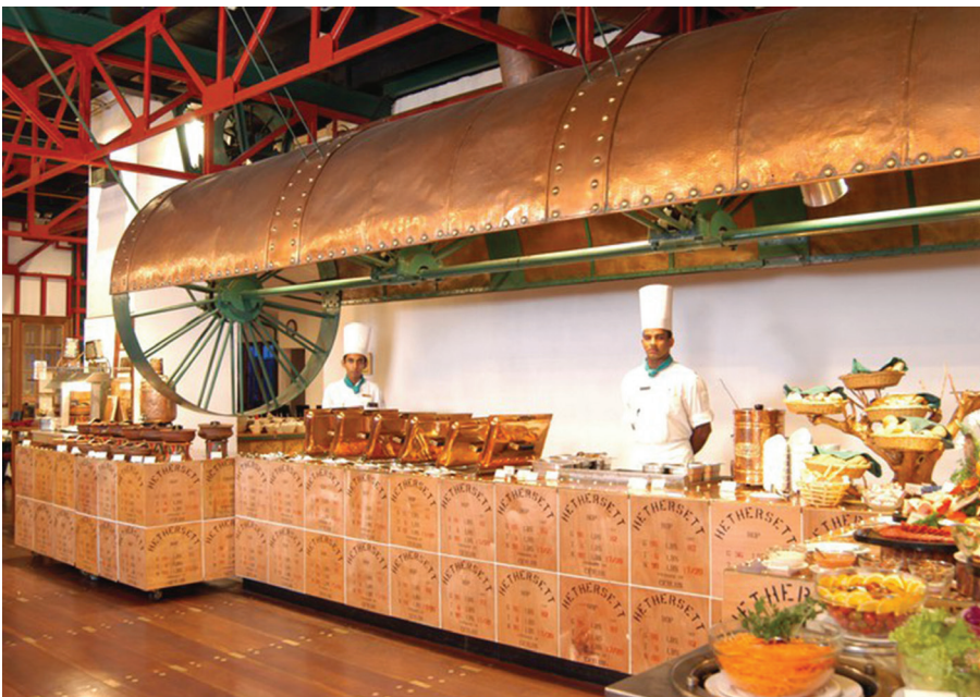
Таблиця 6. Характеристика застосування автентичного обладнання в інтер'єрах готелю Tea Factory

— суспільний інтер'єр атріуму має локальний акцент у вигляді механізму, що залишився від минулого виробництва; — низка окремих елементів автентичного обладнання, інтегрована у середовище бару як складова його обладнання